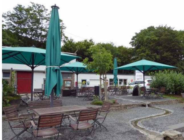
Campingpark Zell/Mosel – 17.8.15 - 20.8.15

Der Campingplatz liegt unmittelbar an der Mosel und ist sehr nahe von der Stadt Zell gelegen.