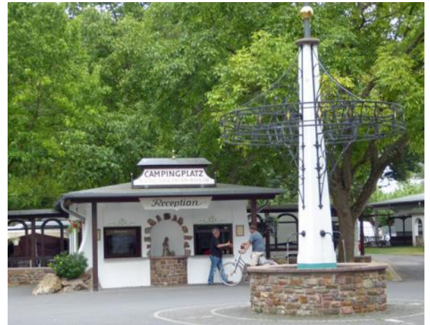
Rudesheim – 20.8.15 - 21.8.15

Rhein entlang, wie schon an der Mosel, nur 2G-Empfang bzw. fast keinen Empfang und keine Performance. Wir fahren somit bis Bingen und mit der Fähre nach Rudesheim am Rhein. Wir übernachten im Campingplatz Rudesheim.