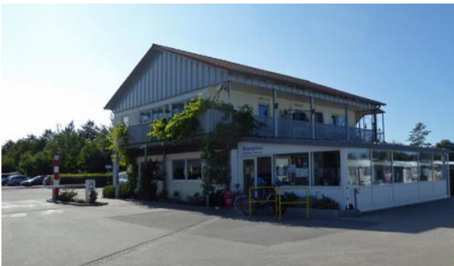
Strandparadies/Großenbrode – 13.8.15 - 16.8.15

Wir bleiben für 3 Tage/Nächte im Camping Strandparadies im Ostseeheilbad Großenbrode.