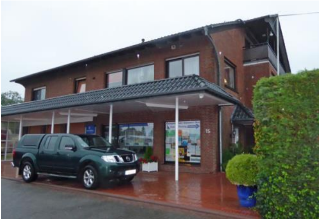
Dümmersee/Hüde – 16.8.14 - 17.8.15

Am Dienstag 18. August ist der Regen erstmal weg und sobald die Sonne durchdringt, haben wir sehr angenehme Temperaturen. Zell ist eine schöne Stadt und hat die schönsten Fachwerkhäuser an der Mosel.