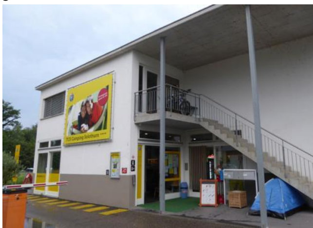
TCS Camping/Solothurn – 23.8.15 - 24.8.15

In Waldshut unmittelbar an der Grenze zur Schweiz regnet es nicht mehr, aber hier war der Campingplatz überfüllt und somit sind wir noch bis Solothurn weiter gefahren.