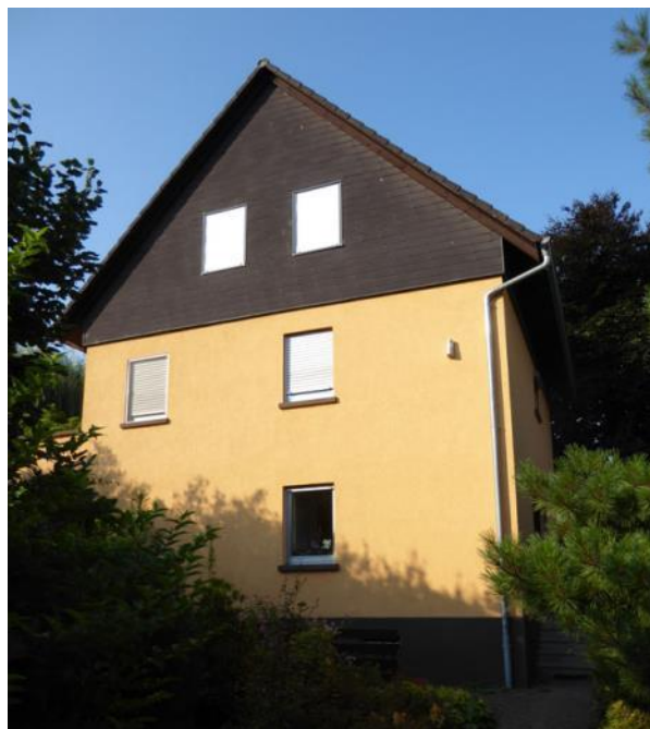
JuWo/Erfenbach b. Kaiserslautern – 21.8.15 - 23.8.15