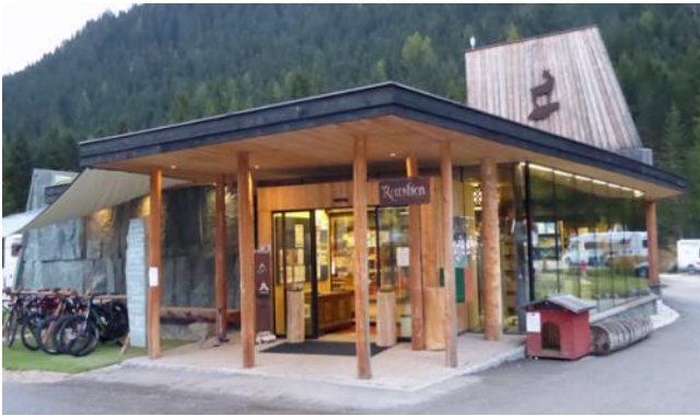
Caravan Park/Sexten – 10.10.2015 - 14.10.2015

Ab Triest fahren wir auf der Autobahn via Udine nach Tolmezzo. Von Tolmezzo fahren wir über Sappada nach San Stefano di Campolongo und weiter über den Kreuzbergpass nach Sexten. Wir bleiben für 4 Nächte in Sexten und genießen die schöne Lage und das wunderschöne Hallenbad. Es ist Mitte Oktober und der Caravan Park in Sexten ist sicher noch zu 60% belegt. Unglaublich aber wahr ....!